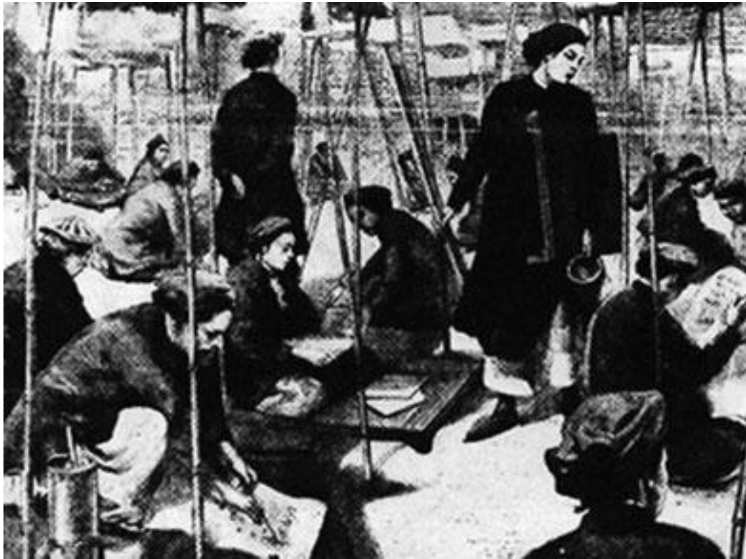
Cách dạy học thời xưa