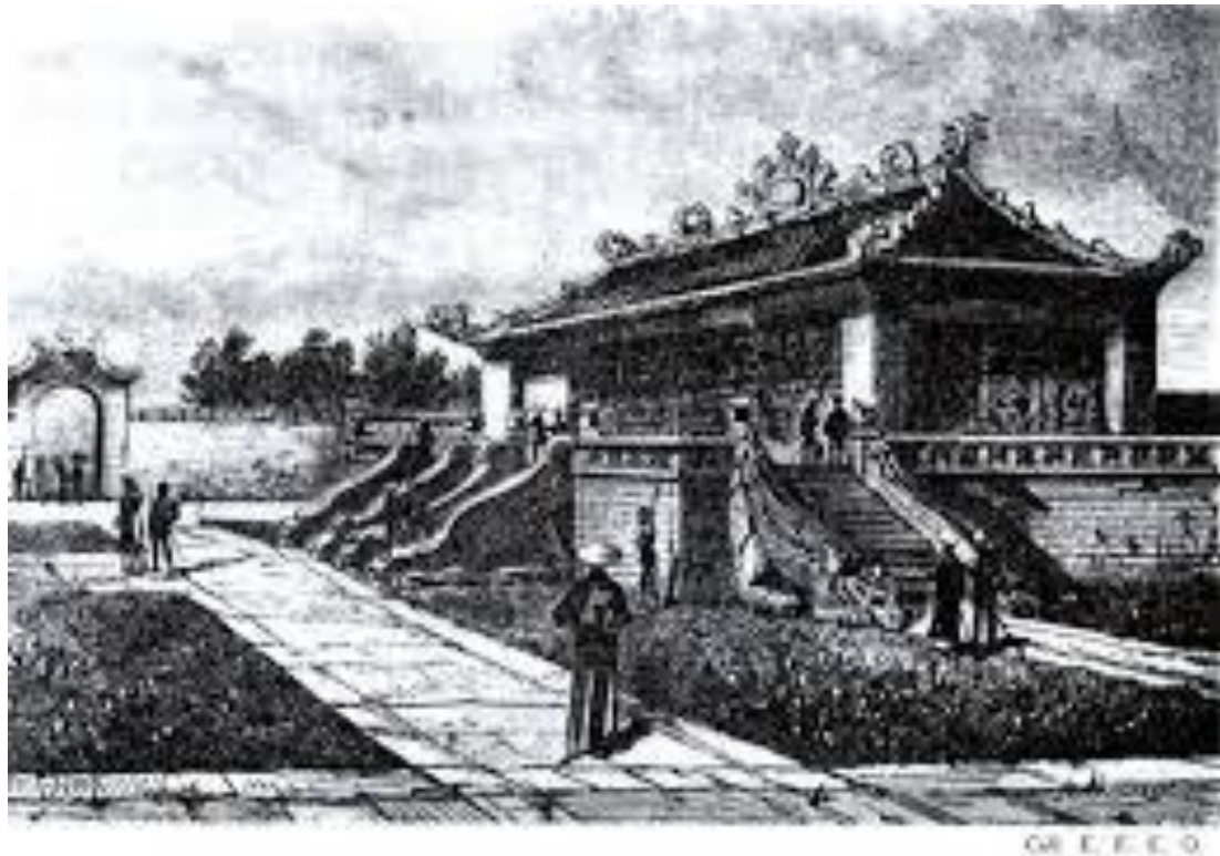
Temple de l'esprit du ciel, à Hanoï (travaux dirigés par M. Francis Garnier) s.