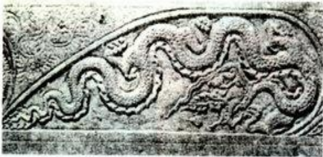
Hình 3. Hình rồng (bia Vinh Lăng)