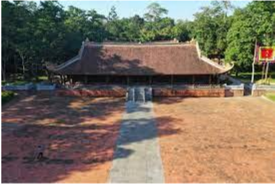
Khu Lam Kinh tại Thọ Xuân , Thanh Hóa