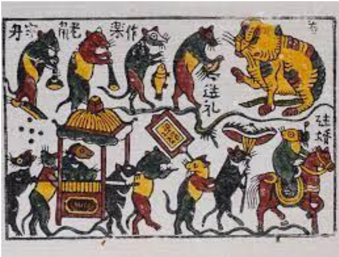
Tranh Đông Hồ