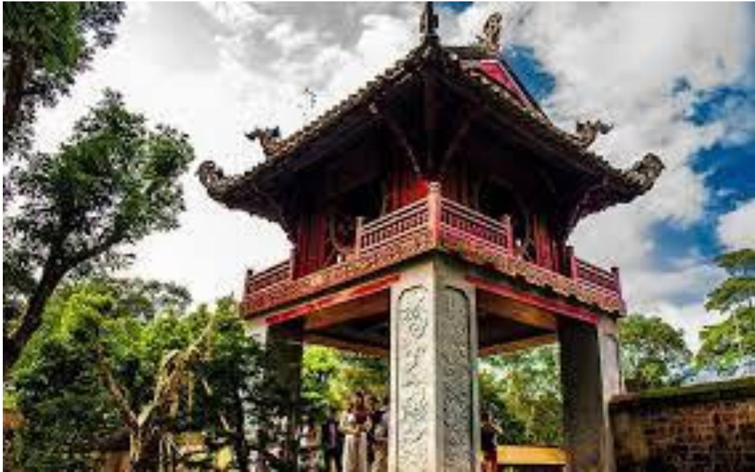
Văn Miếu, Quốc Tử Giám