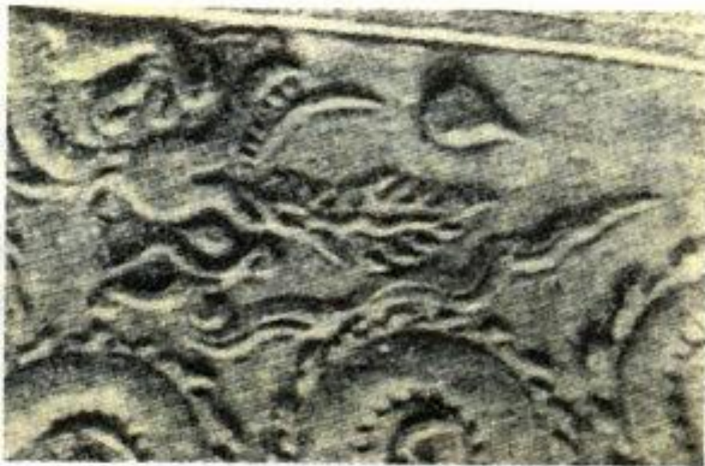
Hình 5. Đầu rồng (bia Vinh Lăng)