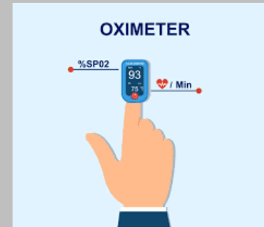
Máy đo SPO2 cầm tay