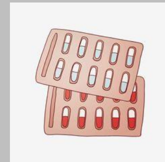
Thuốc hạ sốt dạng uống, đặt hậu môn , Oresol, thuốc ho, vimatin tổng hợp