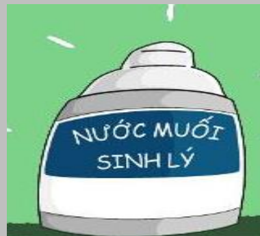
Nước muối sinh lý