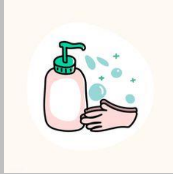
Nước sát khuẩn