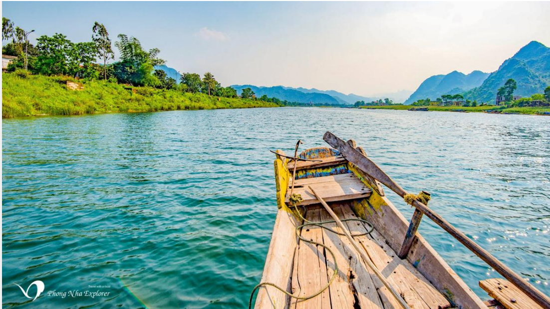
Thuyền xuôi dòng Sông Son vào hang động Phong Nha

Sông Son rộng chừng 35-40 mét, nước xanh ngắt, trong thấu đáy, nhìn rõ cả những đàn cá đang bơi. Nước thì xanh như màu xanh đồng, nhưng lại gọi là sông Son vì vào mùa mưa, nước mưa bào mòn đất đá ở các triền núi đổ xuống làm nước sông đỏ như màu gạch son. Nhưng có một câu chuyện ly kỳ khác, có lẽ đã ra đời từ thời khai thiên lập địa, cũng giải thích về tên của dòng sông Son.