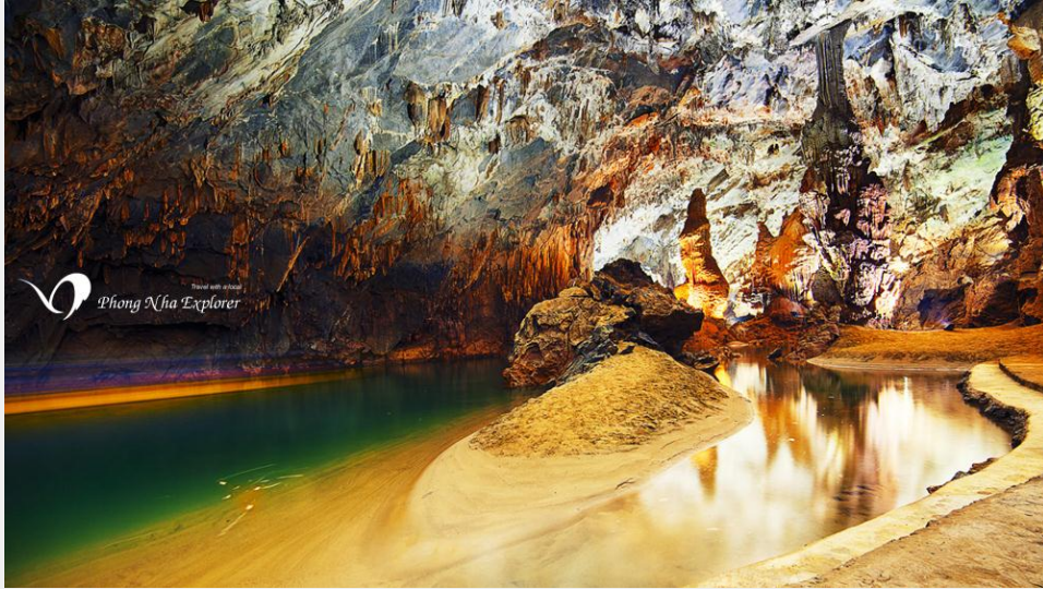
Vị trí đẹp nhất Động Phong Nha với dòng sông ngầm và bãi cát dài

Chúng kiến những hình ảnh kỳ lạ của tạo hóa thiên nhiên, mỗi du khách không khỏi xúc động trước vẻ đẹp của thạch nhũ. Cái đẹp mang những hình dáng vô cùng hoang sơ nhưng mang tính kỳ dị và luôn biết cách thu hút mọi ánh mắt của du khách dồn về phía mình với những hình thù kỳ dị nguyên sơ mà trí tưởng tượng của con người tha hồ gán cho chúng biết bao huyền thoại, sự tích... Khó có thể mô tả vẻ đẹp hùng vĩ của những buồng, những hành lang đá vôi phủ đầy thạch nhũ long lanh dưới ánh đuốc của dòng sông ngầm.