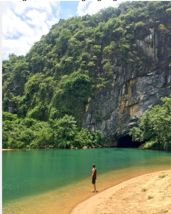
Khung cảnh trước cửa động

Trong lòng động mát như trong căn phòng gắn máy lạnh. Đây là cảm giác ai cũng nhận thấy giống nhau, chứ còn từ đây vào trong động, một thế giới u linh, kỳ thú ... sẽ hiện ra; và chúng huyền ảo đến mức sự cảm nhận của chúng ta có thể không ai giống ai nữa.