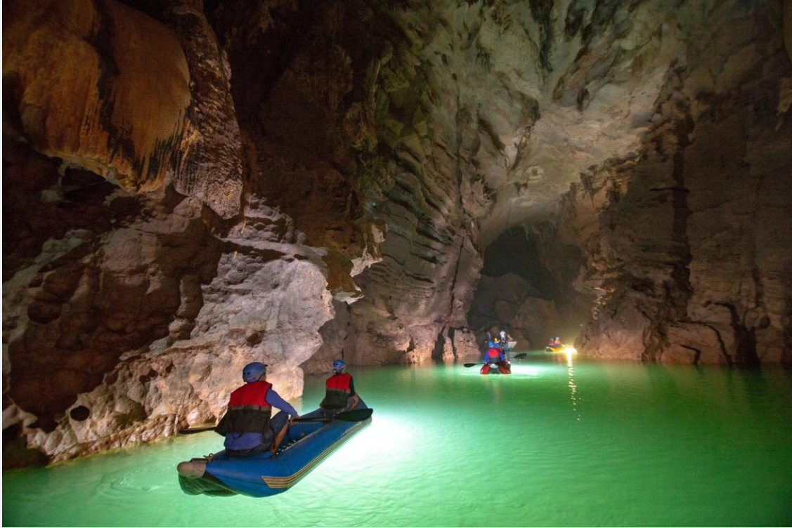
Du khách tham hiểm Động Phong Nha 4500m

Vào trong hang mới biết thế nào là nước chảy, đá mòn! Sự xâm thực của nước mưa vào đá vôi đã gây ra tình trạng cắt xẻ mảnh liệt ở các dãy núi, khối núi, tạo thành những địa hình đa dạng: Lòng núi bị đào thành hang động, đường hầm, sông ngầm, giếng sâu; các khối núi bị tách thành vách dựng đứng và những cảnh tượng lạ lùng... Khi bạn ngược nhìn lên rồi xoay ngang, xoay ngược ngắm nhìn, những hình ảnh của nhũ đá, của những ánh đèn lung linh phản chiếu. Ai cũng phải trầm trồ vì vẻ đẹp.