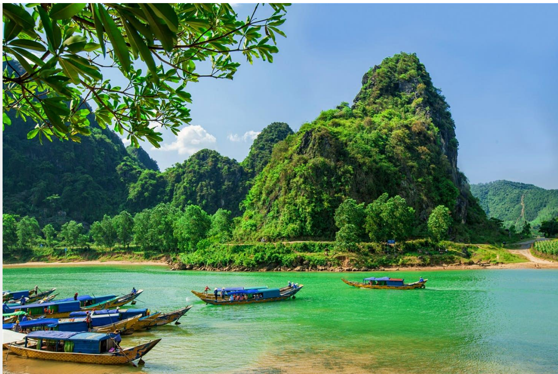
Phong cảnh sông núi hữu tình

Từ Thành Phố Đồng Hới tỉnh Quảng Bình đi đường Phan Đình Phùng theo đường Hồ Chí Minh để bắt đầu chuyến du lịch khám phá động Phong Nha “Di sản thiên nhiên thế giới Phong Nha-Kẻ Bàng”, đến Phong Nha, Du khách xuống bến thuyền đi theo sông Son vào động Phong Nha.