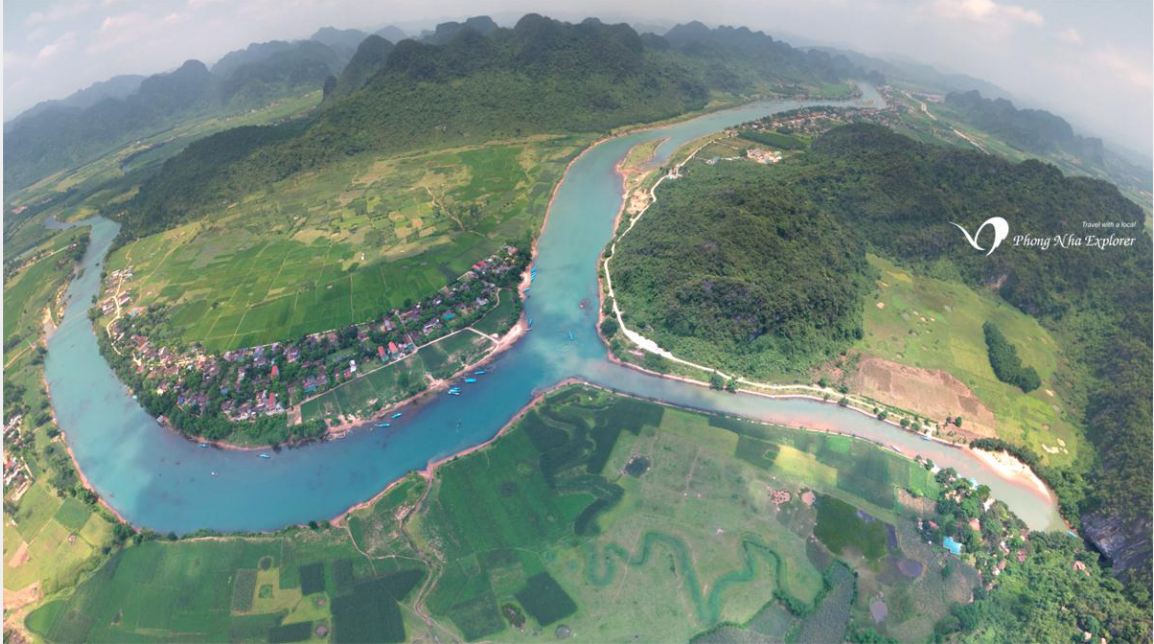
Flycam Ngã 3 Sông Sơn vào hang Động Phong Nha

Dòng nước tươi mát cỏ cây, cứu sống muôn loài, nhưng vị đại sư bị triệu về Trời chịu hình phạt. Dân làng cảm kích tấm lòng son của vị đại sư nên đặt tên cho sông này là sông Sơn. Sông Sơn chảy từ động Phong Nha và nối vào sông Gianh.