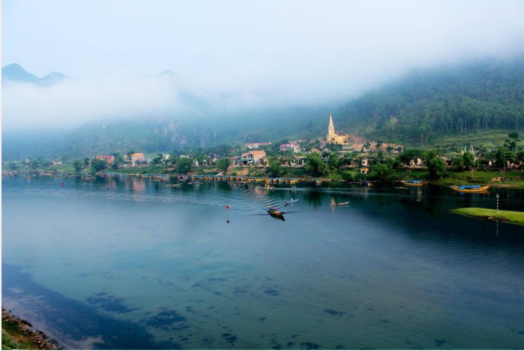
Phong cảnh hữu tình hai bên dòng sông Son