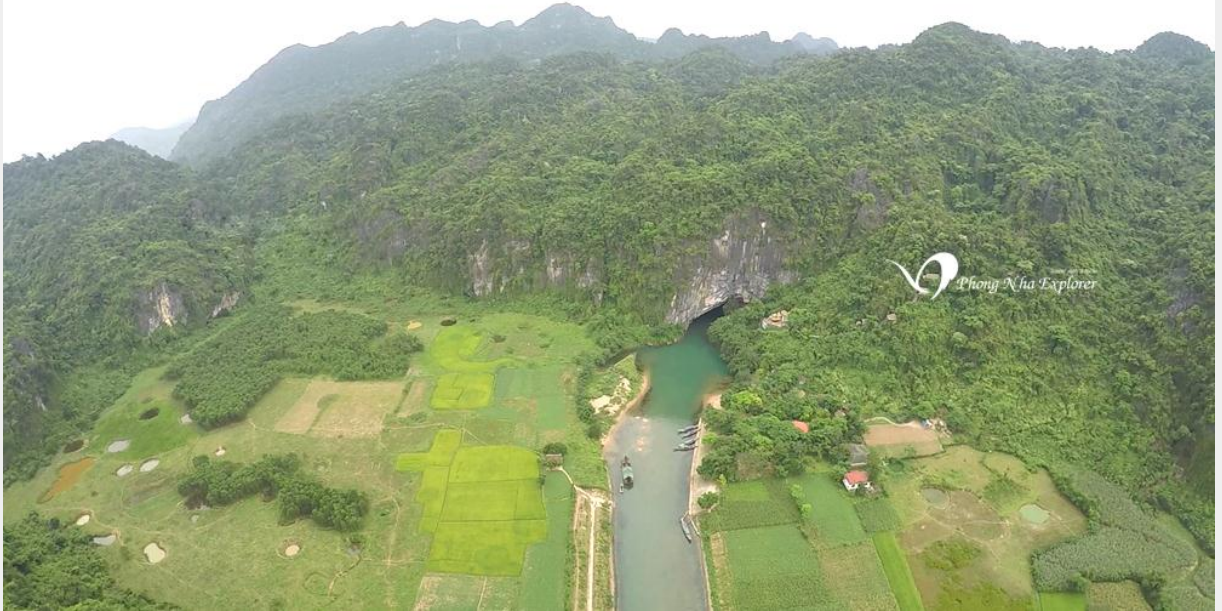
Cửa vào Động Phong Nha nhìn từ trên cao

Trong lòng động mát như trong căn phòng gắn máy lạnh. Đây là cảm giác ai cũng nhận thấy giống nhau, chứ còn từ đây vào trong động, một thế giới u linh, kỳ thú ... sẽ hiện ra; và chúng huyền ảo đến mức sự cảm nhận của chúng ta có thể không ai giống ai nữa.