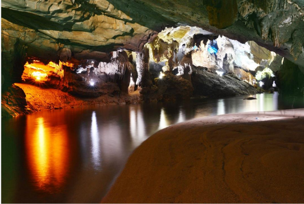
Động Phong Nha có sông ngầm và bãi cát tuyệt đẹp

Du khách sẽ sang hang Tiên và hang Cung Đình cùng những cột nhũ đá cao trên 20m được thiên nhiên tạo nên. Đây cũng là hai hang tiêu biểu của động Phong Nha có hệ thống nhũ đá huyền ảo và kỳ vĩ cùng hàng ngàn những kiệt tác được hình thành bởi tạo hoá, với vô số những hình ảnh kỳ lạ và hấp dẫn. Trong hang Tiên, thiên nhiên đã tạo trên vách đá hình dáng những nàng tiên với mái tóc dài, màu vàng óng ả.