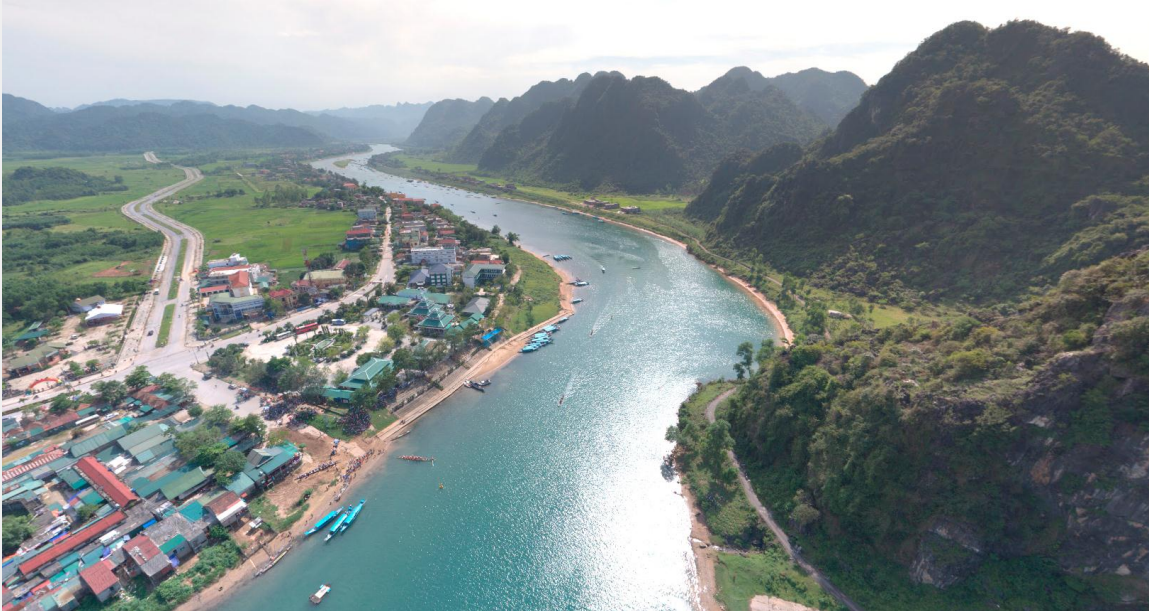
Toàn cảnh bến thuyền Sông Son nơi bắt đầu tham quan Động Phong Nha

Từ Thành Phố Đồng Hới tỉnh Quảng Bình đi đường Phan Đình Phùng theo đường Hồ Chí Minh để bắt đầu chuyến du lịch khám phá động Phong Nha “Di sản thiên nhiên thế giới Phong Nha-Kẻ Bàng”, đến Phong Nha, Du khách xuống bến thuyền đi theo sông Son vào động Phong Nha.