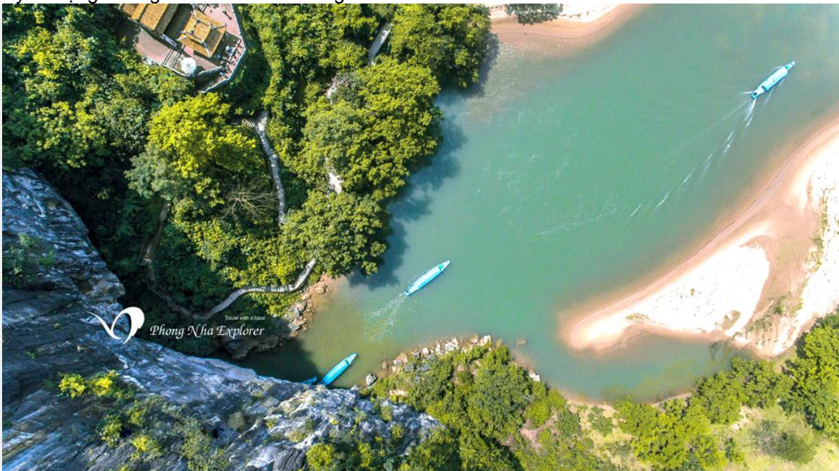
Sông Sơn chảy ngầm trong Động Phong Nha kỳ vĩ

Dòng nước tươi mát cỏ cây, cứu sống muôn loài, nhưng vị đại sư bị triệu về Trời chịu hình phạt. Dân làng cảm kích tấm lòng son của vị đại sư nên đặt tên cho sông này là sông Sơn. Sông Sơn chảy từ động Phong Nha và nối vào sông Gianh.