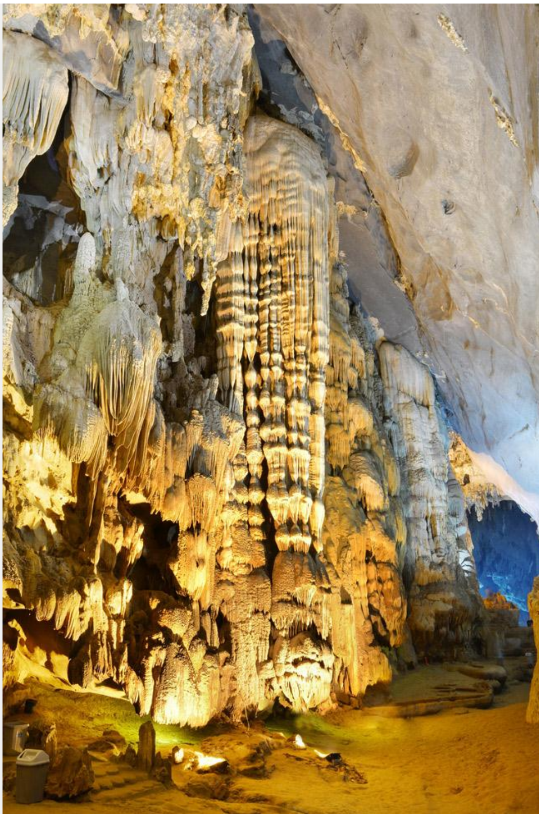
Hình ảnh mái tóc tiên