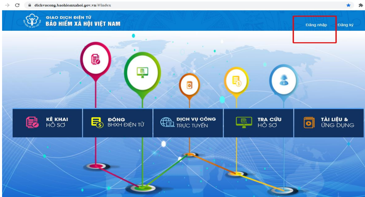
Hình 1.1 Màn hình trang chủ

Bước 1: Truy cập địa chỉ https://dichvucong.baohiemxahoi.gov.vn . Tại màn hình chọn “Đăng Nhập”