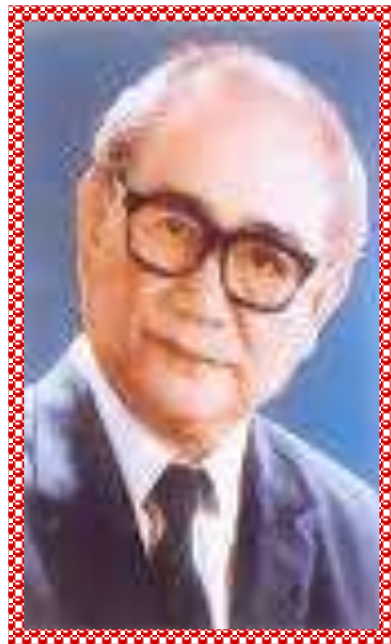
- Lưu Hữu Phước (1921 - 1989):