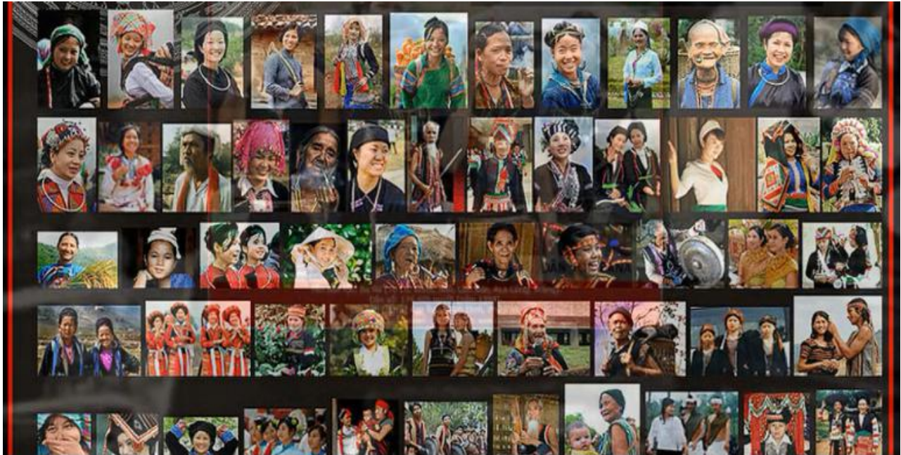
Hình 1: Đại gia đình dân tộc Việt Nam