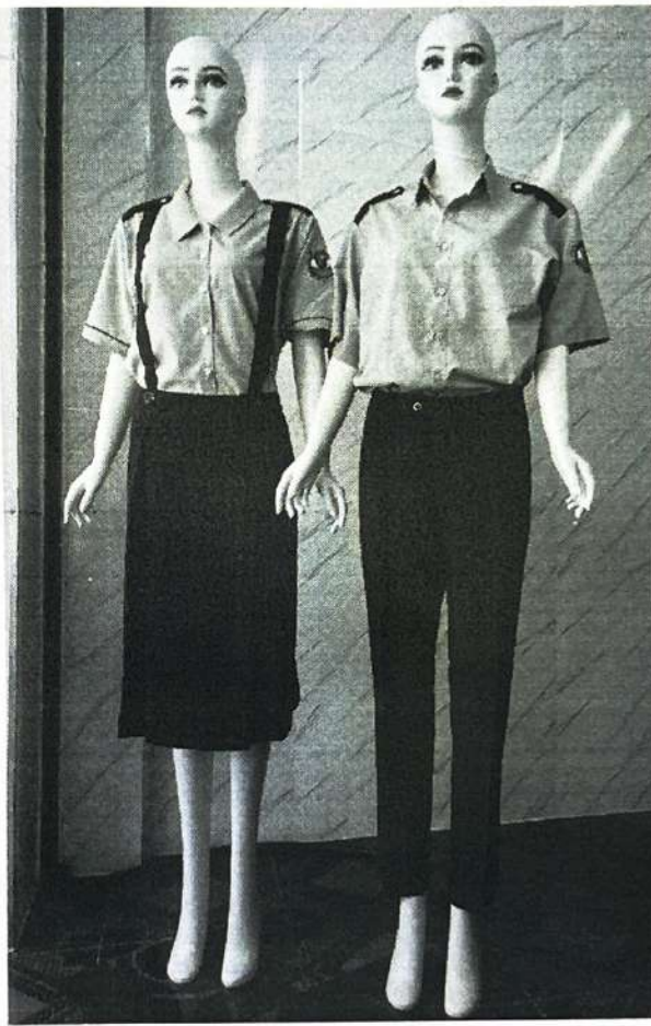
Áo xanh bán trú

- Phụ huynh học sinh ở các khối lớp 6, 7, 8, 9 có nhu cầu mua đồng phục liên hệ với các bạn đoàn viên thanh niên theo thời gian như trên để mua đồng phục tại nhà trường.