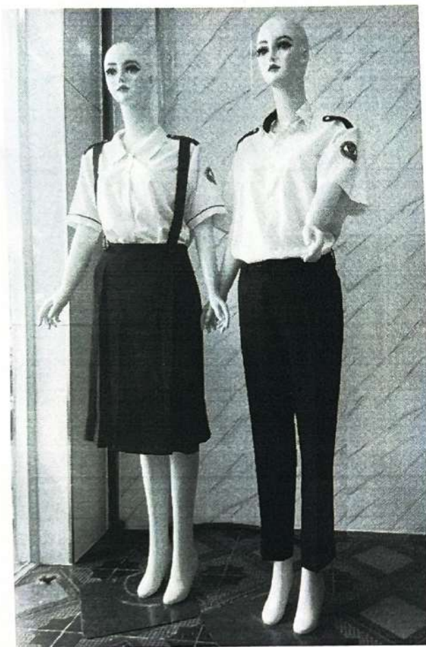
Áo trắng không bán trú

- Nam quần tây dài màu xanh dương đậm, nữ váy qua gối màu xanh dương đậm có dây treo. Đồng phục nam và nữ đều có cầu vai ở cả bán trú và không bán trú. Đồng phục nam không bán trú có cổ viền bên trong màu xanh dương đậm. Đồng phục nữ có viền nơi tay áo.