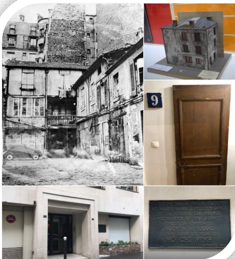
Ngôi nhà số 9 ngõ Compoin, nơi ở của Nguyễn Ái Quốc tại Pháp. Tháng 7/1920 Nguyễn Ái Quốc đã đọc bản "Sơ thảo lần thứ nhất những Luận cương về vấn đề dân tộc và vấn đề thuộc địa" của V.I.Lenin trên báo L'Humanité (Nhân đạo) của Đảng Xã Hội Pháp. Qua luận cương, Người đã thấy con đường giải phóng dân tộc đúng đắn