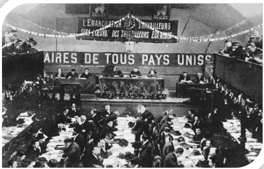
Toàn cảnh Đại hội đại biểu toàn quốc lần thứ 18 Đảng Xã Hội Pháp Nguyễn Ái Quốc tham dự với tư cách đại biểu Đông Dương. Tại Đại hội, người tham gia sáng lập Đảng Cộng Sản Pháp và trở thành người cộng sản Việt Nam đầu tiên. Trong ảnh: Nguyễn Ái Quốc ngồi đầu dãy bàn thứ hai, phía tay trái Đoàn Chủ Tịch. Thành phố Tua, Cộng hòa Pháp, tháng 12/1920.