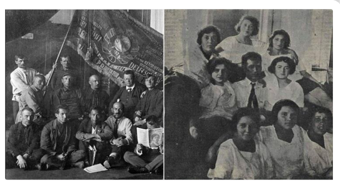
Người chụp ảnh kỷ niệm với các đoàn viên Công xã Leninsky Zakal, Moskva, tháng 10-1924. (ảnh trái) – Nguyễn Ái Quốc và các đại biểu dự Đại hội lần thứ V Quốc tế cộng sản (ảnh bên phải)