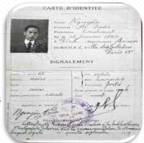
Thẻ Căn cước của Nguyễn Ái Quốc tại Pari (Pháp) năm 1919