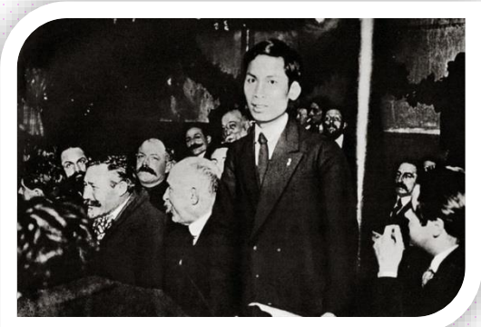
Nguyễn Ái Quốc phát biểu tại đại hội lần thứ 18 Đảng Xã Hội Pháp