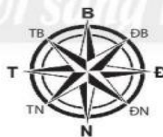
Hình 3.2. Kim chỉ nam