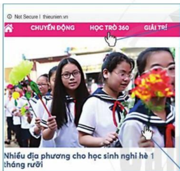
Hình 2. Theo trang chủ của website báo Thiếu niên Tiền phong, ngày 28/6/2020

Website: tập hợp các trang web (web pages) có liên quan đến nhau và được gắn cùng một địa chỉ.