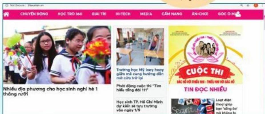
Hình 1. Theo trang web báo Thiếu niên Tiền phong, ngày 28/6/2020