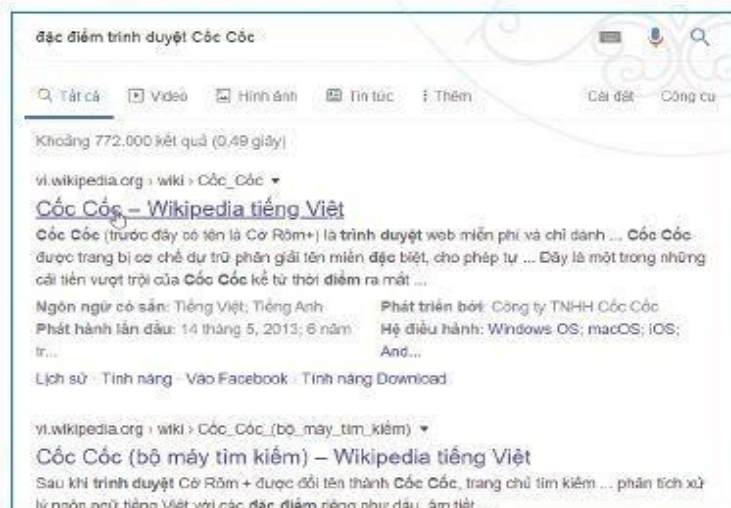
Hình 2a. Kết quả tìm với từ khoá “đặc điểm trình duyệt Cốc Cốc”

Ví dụ: Tìm kiếm với từ khoá “đặc điểm trình duyệt Cốc Cốc” trên Google.