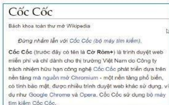
Hình 2b. Trang web kết quả đầu tiên