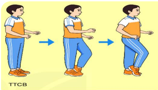
Hình 4. Động tác bước nhỏ

- Câu hỏi: Tìm hiểu trên internet, sách giáo khoa... các giai đoạn trong xuất phát cao.