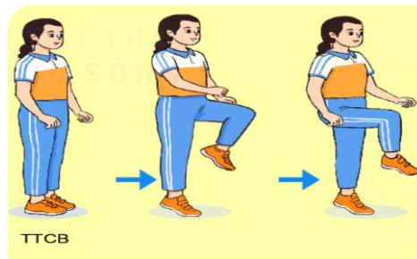
Hình 5. Động tác nâng cao đùi