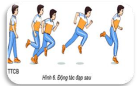
Hình 6. Động tác đạp sau