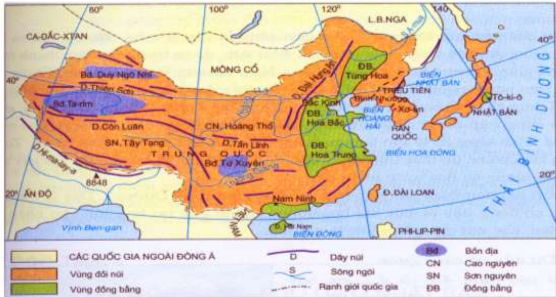
Hình 12.1. Lược đồ tự nhiên khu vực Đông Á

Em hãy kết hợp đọc và khai thác thông tin SGK, bản đồ, lược đồ hình 12.1 (trang 41) cho biết: