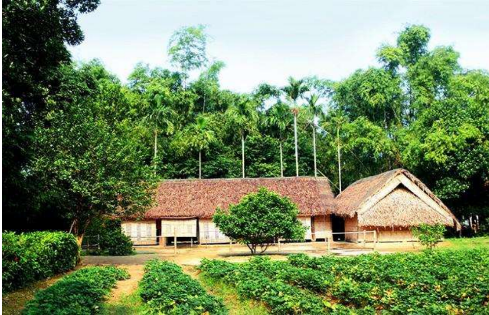
Nhà sàn của Bác tại xã Kim Liên, Nam Đàn, Nghệ An.

HS quan sát, trình bày suy nghĩ, cảm nhận của mình về bức ảnh ?