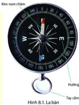
Hình 8.1. La bàn