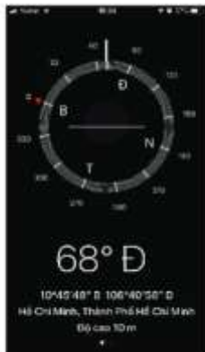
Hình 8.2. Ứng dụng la bàn trên điện thoại thông minh