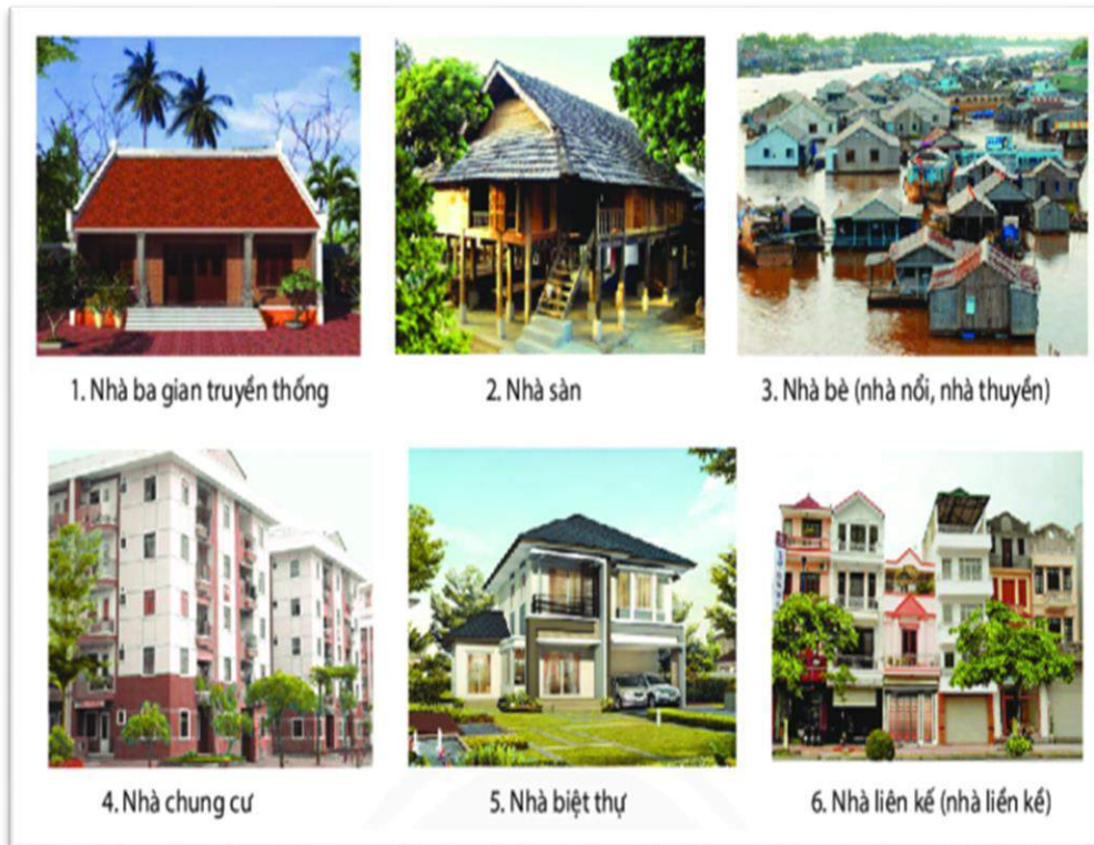
1. Nhà ba gian truyền thống