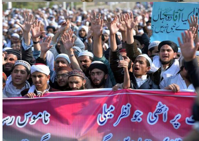
Các cuộc xung đột, biểu tình