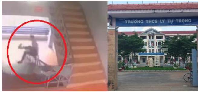
Trượt cầu thang 1 nam sinh THCS tử vong Đồng Nai - 10/10/2020