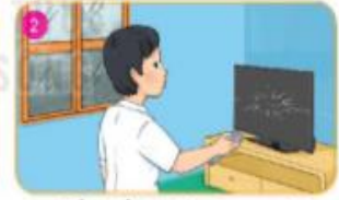
Tắt thiết bị điện trong nhà (điện thoại di động, tivi,...)