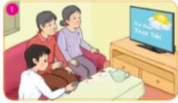
Thường xuyên xem dự báo thời tiết.