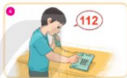
Gọi 112: Yêu cầu trợ giúp, tìm kiếm cứu nạn trên phạm vi toàn quốc.