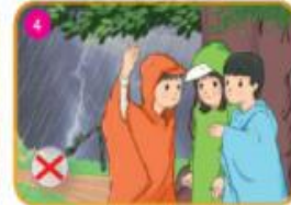
Không trú dưới gốc cây, cột điện, giữa cánh đồng,...