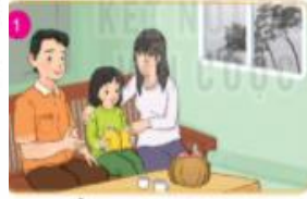
Ở trong nhà khi trời mưa dông, lốc, sét.