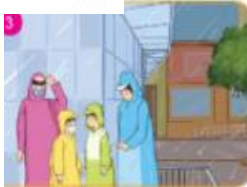
Nếu đang đi ngoài đường, cần nhanh chóng tìm nơi trú ẩn an toàn.