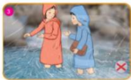
Không đi qua sông, suối khi có lũ.