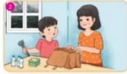
Chủ động chuẩn bị phòng, chống (đèn pin, thực phẩm, áo mưa,...)